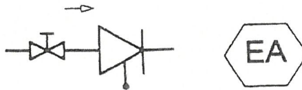
Bild 2 – Sicherungseinrichtung der Entnahmevorrichtung (Prinzip nach DIN 1988-2 und Symbol und Bezeichnung nach EN 1717)

(Ist Bestandteil der Bauwasseranlage – SWB GmbH)